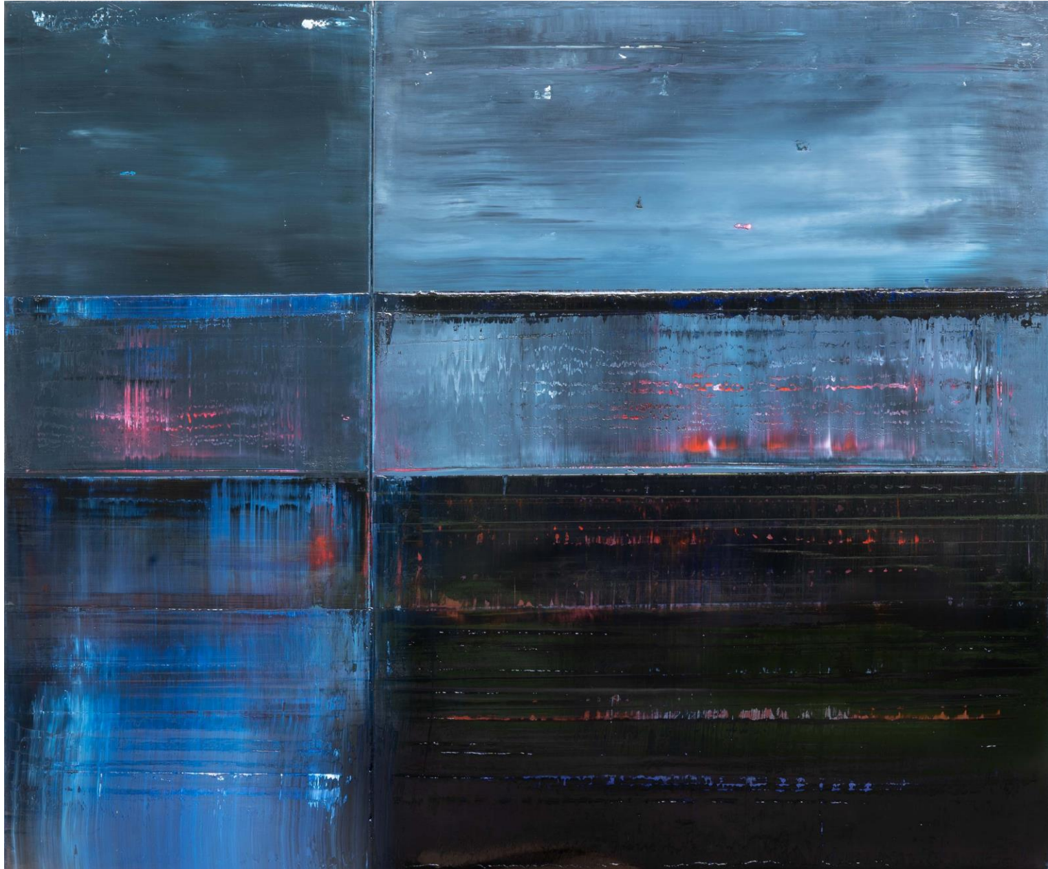
2019 • Öl auf Leinwand • 120x150 cm | ohne Titel