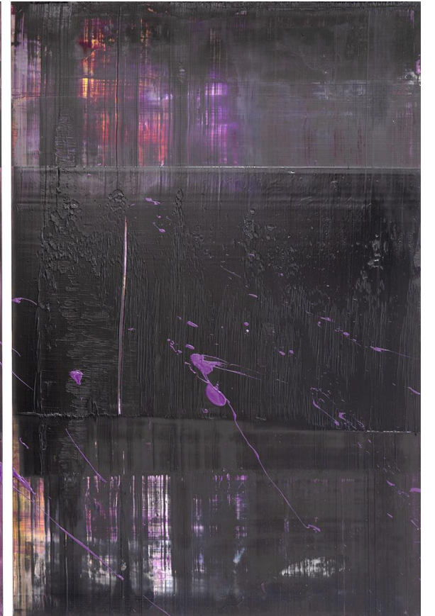
2018 • Öl auf Stahl • 81x60 cm | Splash 1