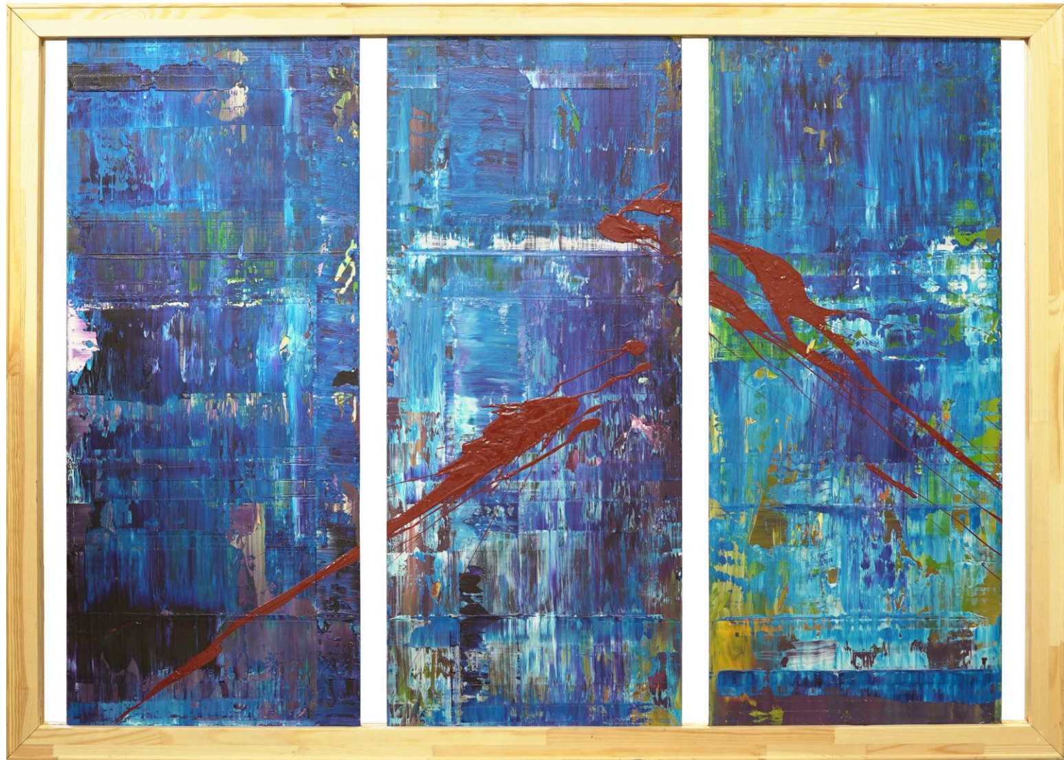
2019 • Öl auf Stahl (gefasst in Holz) • 140x100 cm | Splash 3