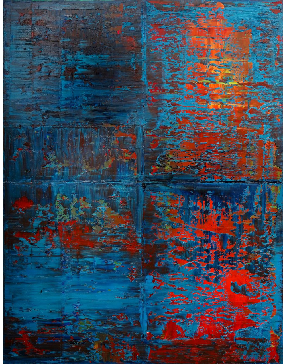
2019 • Öl auf Leinwand • 120x100 cm | 4 Jahreszeiten