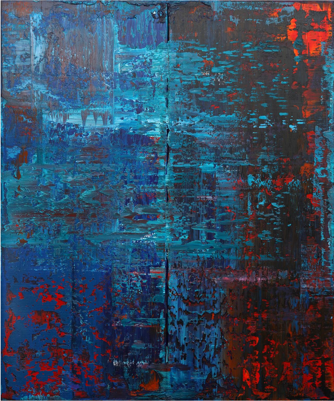
2019 • Öl auf Leinwand • 130x110 cm | 8 Monate