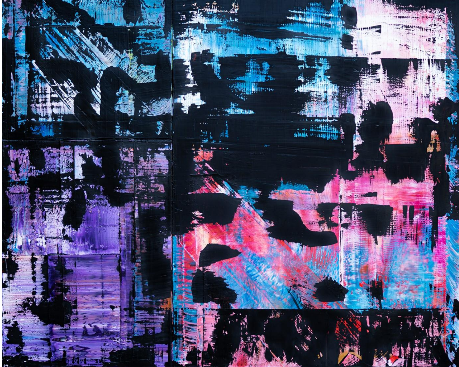
2020 • Öl auf Leinwand • 190x150 cm | Blackout